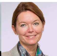
Lise Kingo UN Global Compact