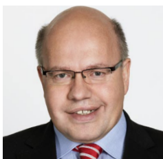
Peter Altmaier Bundeskanzleramt